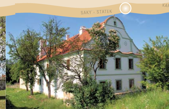
SAKY - STÁTEK