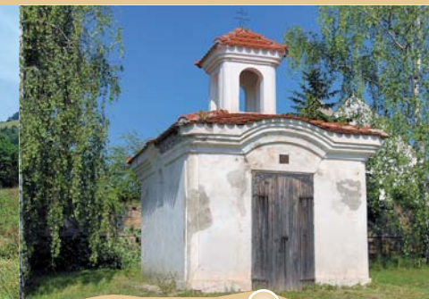
SAKY - KAPLIČKA

3 Začátek trasy je u Infocentra na Masarykově náměstí (bývalá piaristická kolej čp. 159), odtud se vydáme Masnokrámskou ulicí na Komenského náměstí a ulicí Fortenskou přejdeme do Záfortenské. Ven z města nás vyvede Smečenská ulice až na křižovatku k Hrdlívu.