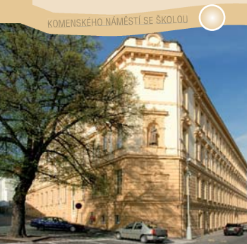
KOMENSKÉHO NÁMĚSTÍ SE ŠKOLOU

Starověké osídlení dnešního katastru obce a jejího okolí dokládají archeologické nálezy z konce 19. století. První písemné zprávy jsou z poloviny 11. století. Cestou z Netovic do Slaného stojí v zatáčce silnice u odbočky