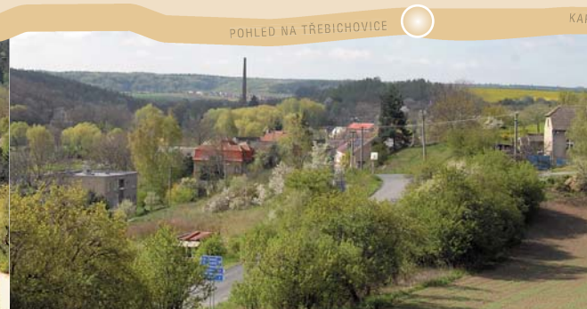
POHLED NA TŘEBICHOVICE