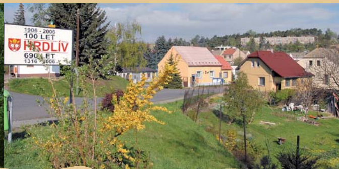
POHLED NA HRDLÍV