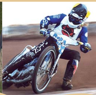
NA OKRUHU PLOCHÉ DRÁHY