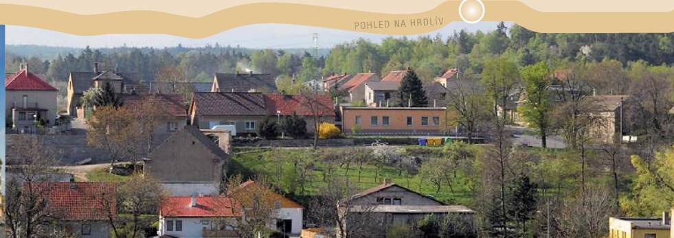
POHLED NA HRDLÍV