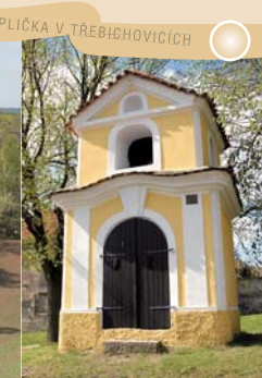
KAPLIČKA V TŘEBICHOVICÍCH