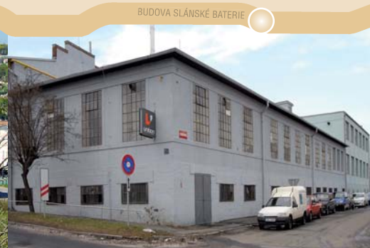
BUDOVA SLÁNSKÉ BATERIE

Celková délka trasy je 19,5 km. Vhodné pro turistiku, cykloturistiku. Trasa vede po silnicích II. a III. třídy.