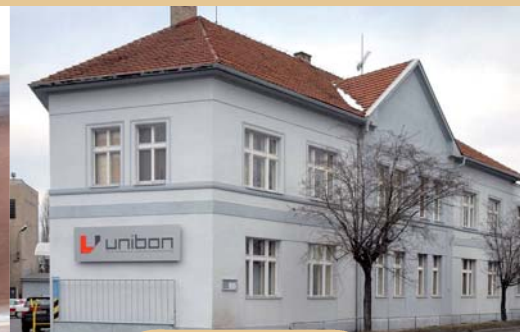
BUDOVA SLÁNSKÉ BATERIE=DRÍVĚJŠÍ FIRMY PALABA

kdy zde bylo instalováno elektrické osvětlení a 26. 5. se uskutečnil první závod za umělého osvětlení na území tehdejšího Československa. Stavba tribuny začala v roce 1984 a dokončena byla v roce 1988. Za železničním přejezdem vpravo vidíme budovu starých slánských jatek.