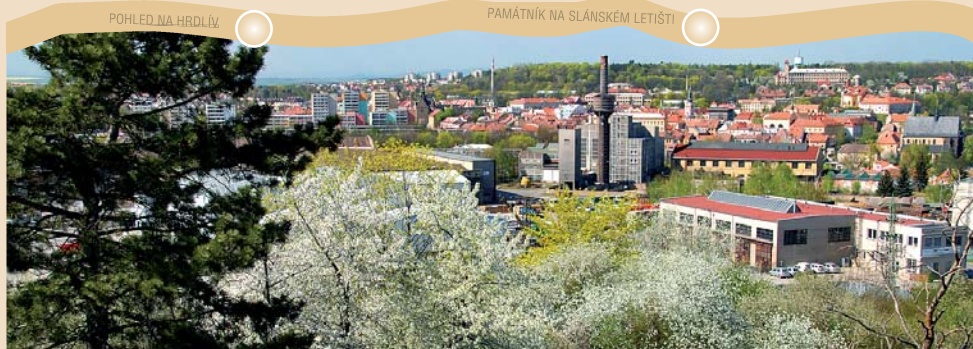
POHLED NA HRDLÍV

Cestou k městu míjíme po pravé straně plochodrážní stadión - 1.12.1922 byl založen MOTO Club Slaný. Myšlenka vybudovat plochodrážní stadion ve Slaném vznikla na přelomu let 1948 -1949. Historie závodů na ploché dráze ve Slaném se začala psát 13.8.1950. Plochá dráha byla a stále je nejvýše postaveným sportem ve městě. Slánská činovníci byli vždy progresivní, důkazem byl rok 1954,