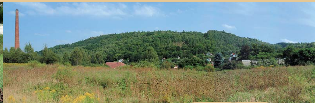
PANORÁMA VINAŘICKÉ HORY